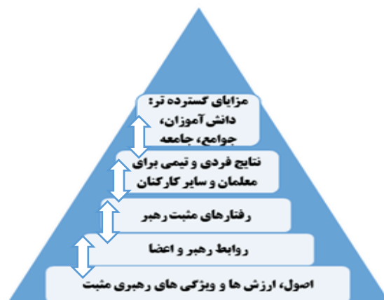
شکل ۳: مدل رهبری مثبت مدرسه

– اقدامات و رفتار مثبت رهبران مدرسه نسبت به دیگر افراد، "تأثیر گسترده بر محیط کار" مدارس، به ویژه روابط مشارکتی معلمان دارد که متعاقباً نتایج مطلوب کار جمعی را افزایش می‌دهد. مورفی به این نتیجه می‌رسد که رهبر مدرسه بر یادگیری دانش‌آموزان زمانی تأثیر می‌گذارد که از توسعه مثبت مدرسه در سطح وسیع حمایت کند، این استدلال، در شکل ۳ نشان داده شده است.